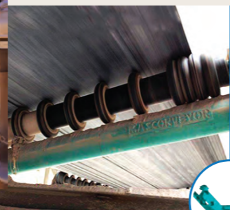
Polines y Rodillos