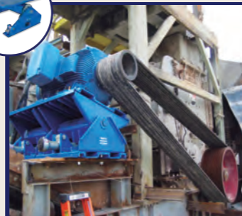
Bases de Motor