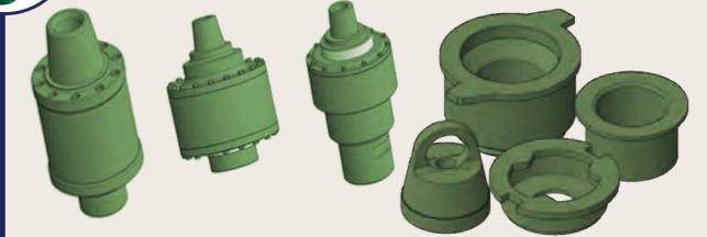
Amortiguadores - Shock Subs